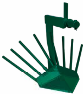
VADILICA KRUMPIRA VK-4 Širina: 80 cm