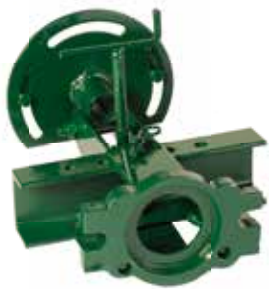
PRIKLJUČAK ZA PLUGOVE PPS ATTACHMENT FOR PLOUGHS PPS ZUBEHÖR FÜR PFLÜGE PPS