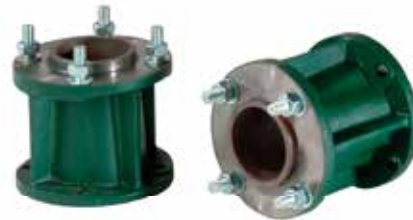
PROŠIRIVAČI KOTAČA 120 MM WHEEL TRACK EXPANDERS 120 MM