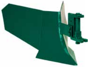
PLUG RAZGRTAČ PR-22